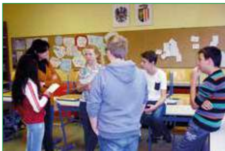
Gespräche mit einer Lehrerin aus der Ost-Slowakei

Am 20. November 2015 befanden sich einige nicht alltägliche Gäste in unserer Schule: drei Lehrer und drei Schülerinnen aus der Ost-Slowakei. In zwei Schulstunden war ein internationaler Austausch über kulturelle, schulische und persönliche Besonderheiten