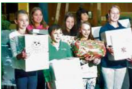
Über 100 Pakete gesammelt

möglich. Die Kommunikation, die aus einer Mischung von Englisch, Deutsch und Slowakisch bestand, war sehr interessant. Mit einer Führung durch unsere Schule und mit großer Begeisterung für die „Gesunde Jause“ endete der Besuch.