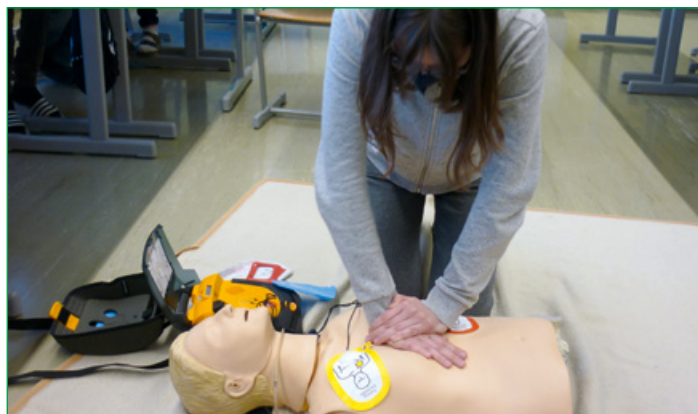
Erste Hilfe Kurs