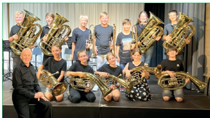
Junior Tuba Ensemble