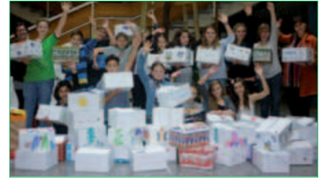
Geschenke für Kinder in der Ukraine

Heuer nahmen unsere Schülerinnen wieder an der Weihnachtspaketaktion teil. Fleißig wurden von ihnen Schulartikel, Spiele, Bekleidung, Hygieneartikel und Stofftiere gesammelt. Vielen Dank den Schülerinnen, die sich